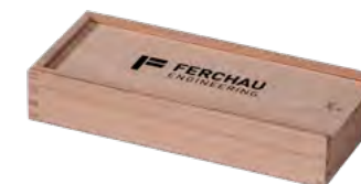
Schiebendeckel, Buche, Siebdruck schwarz Sliding lid, beech, black screen printing