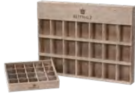
Päsentationsdisplay, Fichte | Birkensperrholz, grau gebeizt, Branddruck Display for presentation, spruce | birch, grey stained, iron branding