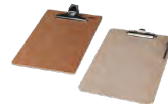
Klembrett, Buche | Birkensperrholz, lackiert, natur, Stifthalter Clip board, beech | birch plywood, natural, varnished, pen holder