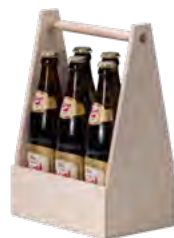
6er Träger, Birkensperrholz Carrier for 6 bottles, birch plywood