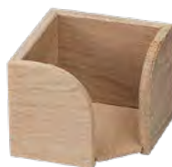
Zettelbox, Eiche, geölt Wooden note box, oak, oiled