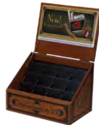
Aufsteller, Birkensperrholz, braun gebeizt, Kunststoffeinsatz, mehrfarbig bedruckt Display stand, birch plywood, brown stained, plastic insert, multi-colour printing