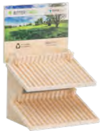
Point of Sale Display, Birke, 2-etagig, zerlegbar, Digitaldruck Point of Sale display, birch, 2 storey, able to be taken apart, digital printing