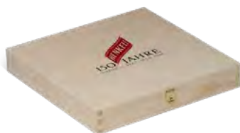
Klappdeckel, Fichte | Pappelsperrholz, Siebdruck 2 farbig Hinged lid, spruce | poplar plywood, screen printing 2 colours