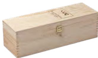
Klappdeckel, Kiefer, Branddruck Hinged lid, pine, iron branding