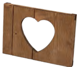
Holzbilderrahmen mit Aufsteller, Fichte, gebürstet, braun gebeizt Picture frame with stand, spruce, brushed, brown stained, with cut-out heart