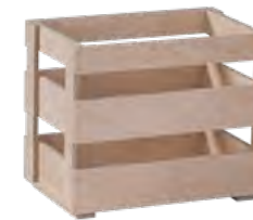
Lattenkiste, Birkensperrholz Crate, birch plywood