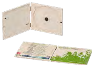
CD Package, Birkensperrholz, Digitaldruck CD packaging, birch plywood, digital printing