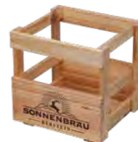
9er Träger, Kiefer, geölt, Branddruck Crate for 9 bottles, pine, oiled, iron branding