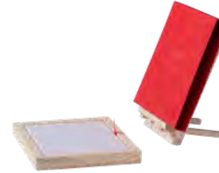
Displayaufsteller, Fichte Display stand, spruce