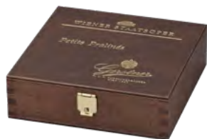
Klappdeckel, Buche | Birkenperrholz, dunkelbraun gebeizt und lackiert, Prägedruck goldfarbig Hinged lid, beech | birch plywood, stained and varnished, blind blocking gold