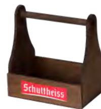
6er Träger, Birkensperrholz, braun gebeizt, farbig bedruckt Carrier for 6 bottles, birch, brown stained, screen printing