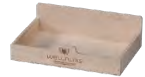
Thekendisplay, Birkensperrholz, genagelt, Branddruck Counter display, birch, nailed, iron branding