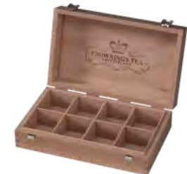
Teebox, Buche, außen lackiert, Deckelstopp, Raster, Branddruck Tea box, beech, varnished exterior, lid stop, grid, iron branding