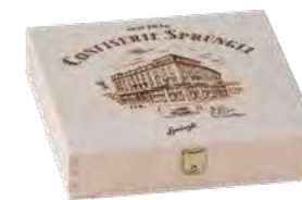
Klappdeckel, Fichte | Pappelsperrholz, Branddruck Hinged lid, spruce | poplar plywood, iron branding