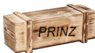
Deckel aufgelegt, Fichte, raue Seite außen, 8 Zierleisten, beflammt, Branddruck Loose lid, spruce, raw side outside, flame-finished, iron branding