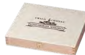
Klappdeckel, Buche | Pappelsperrholz, Siebdruck Hinged lid, beech | poplar plywood, screen printing