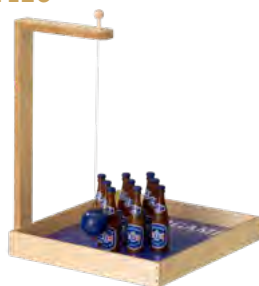
Kegelspiel, Birkensperrholz, lackiert, bedruckt, Bausatz Skittles, birch plywood, varnished, screen printing, kit