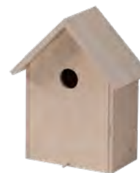
Vogelhaus für Flasche, Birkensperrholz Bird house for bottle, birch plywood