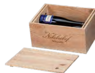
Kiefer, Guillotine, Deckel zum Vernageln, Branddruck Pine, guillotine, nailed lid, iron branding