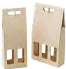
2er & 3er Weinträger, Birkensperrholz Carrier for 2 or 3 bottles, birch plywood