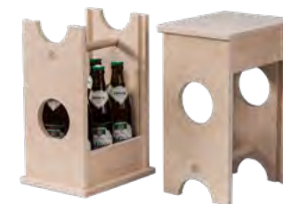
6er Bierhocker, Birkensperrholz For 6 bottles, birch plywood