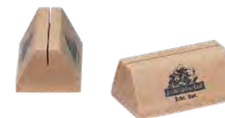
Tischauflieger, Buche, lackiert, Siebdruck Place card holder, beech, varnished, screen printing