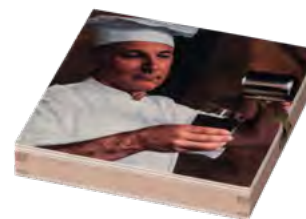
Flachdeckelkiste, Buche | Pappelsperrholz, Digitaldruck Flat lid box, beech | poplar plywood, digital printing