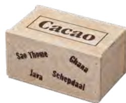
Deckel aufgelegt, Fichte & Kiefernsperrholz, Siebdruck Nailed loose lid, spruce & pine plywood, screen printing