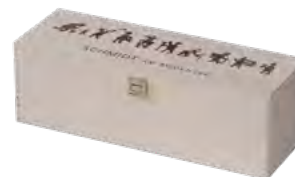
Klappdeckel, Birkensperrholz, Branddruck Hinged lid, birch plywood, iron branding