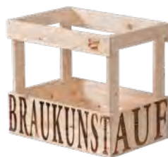
Träger, Fichte, Branddruck Crate, spruce, iron branding