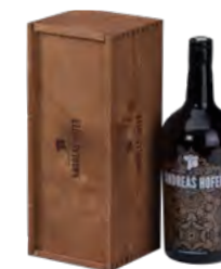
Schiebedeckel, Fichte | Birkensperrholz, braun gebeizt, Branddruck Sliding lid, spruce | birch plywood, stained brown, iron branding