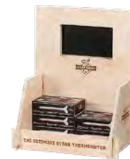
Steckbares Display, Birkensperrholz, beflammt, Branddruck Pluggable display, birch plywood, flamed, iron branding