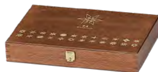
Klappdeckel, Buche | Birkenperrholz, gebeizt, lackiert, Prägedruck goldfarbig Hinged lid, beech | birch plywood, stained and varnished, gold embossing