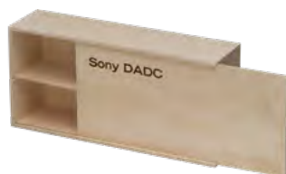
Schiebedeckel, Birkensperrholz, Ausziehleiste, Branddruck Sliding lid, birch plywood, seperating strip, iron branding