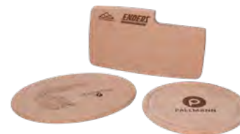
Holzbrettchen, Buche, Branddruck Platters, beech, iron branding