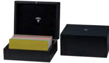
Holzbox, komplett schwarz lackiert, Deckelpolster mit silbernem Prägedruck Wooden box, black varnished, cover padding with silver embossing