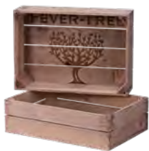
Holzharasse, Fichte, antik grau gebeizt, Branddruck Bottle crate, spruce, antique grey stained, iron branding